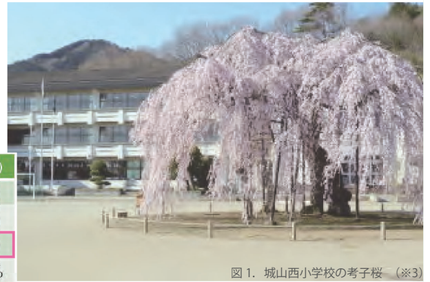
図 1. 城山西小学校の考子桜（※ 3）