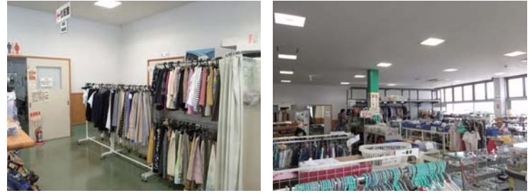
図3 リサイクルショップぶうめらん店内